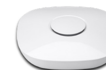
Tribe 2 Smartbox Art.nr: 17436 Ean: 7317900174360