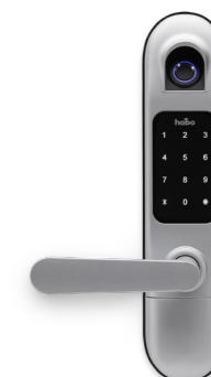
Tribe 2 Silver Art.nr: 17432 Ean: 7317900174322