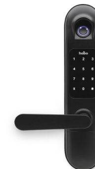
Tribe 2 Svart Art.nr: 17435 Ean: 7317900174353